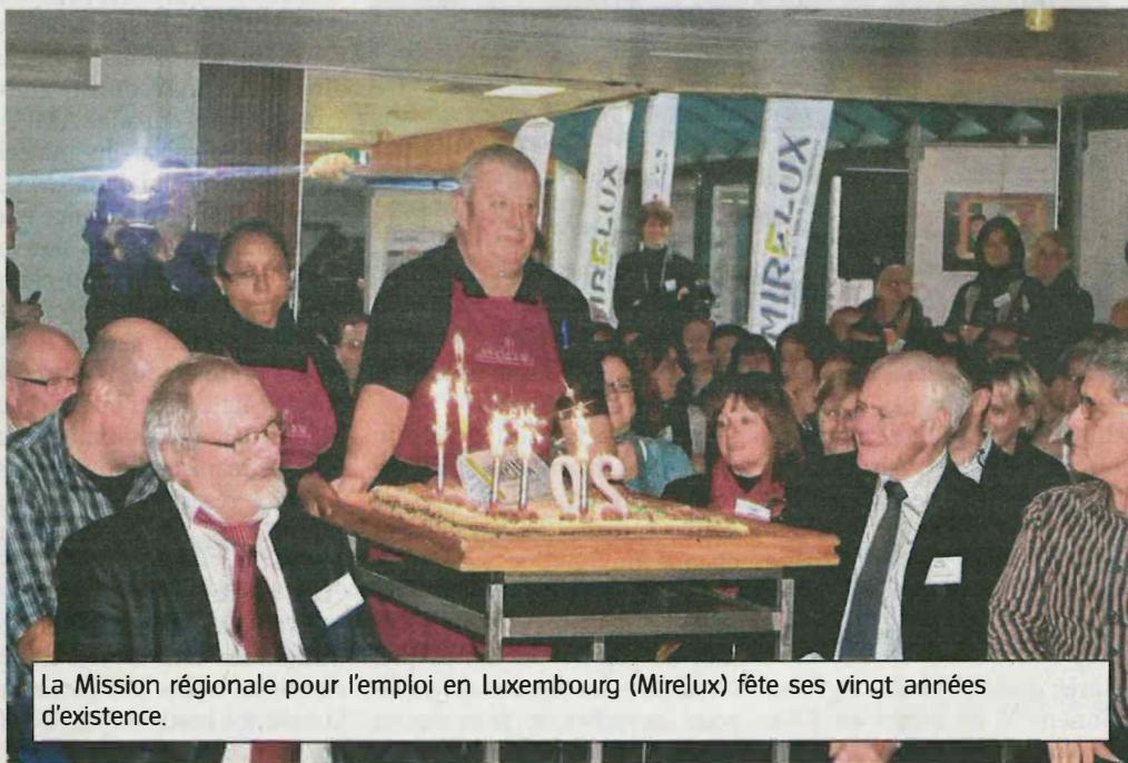
La Mission régionale pour l'emploi en Luxembourg (Mirelux) fête ses vingt années d'existence.

En vingt ans, ce sont plus de quatre mille demandeurs d'emploi qui ont bénéficié d'un accompagnement.